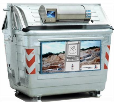
Fig.1 – Cassonetto RSU con calotta