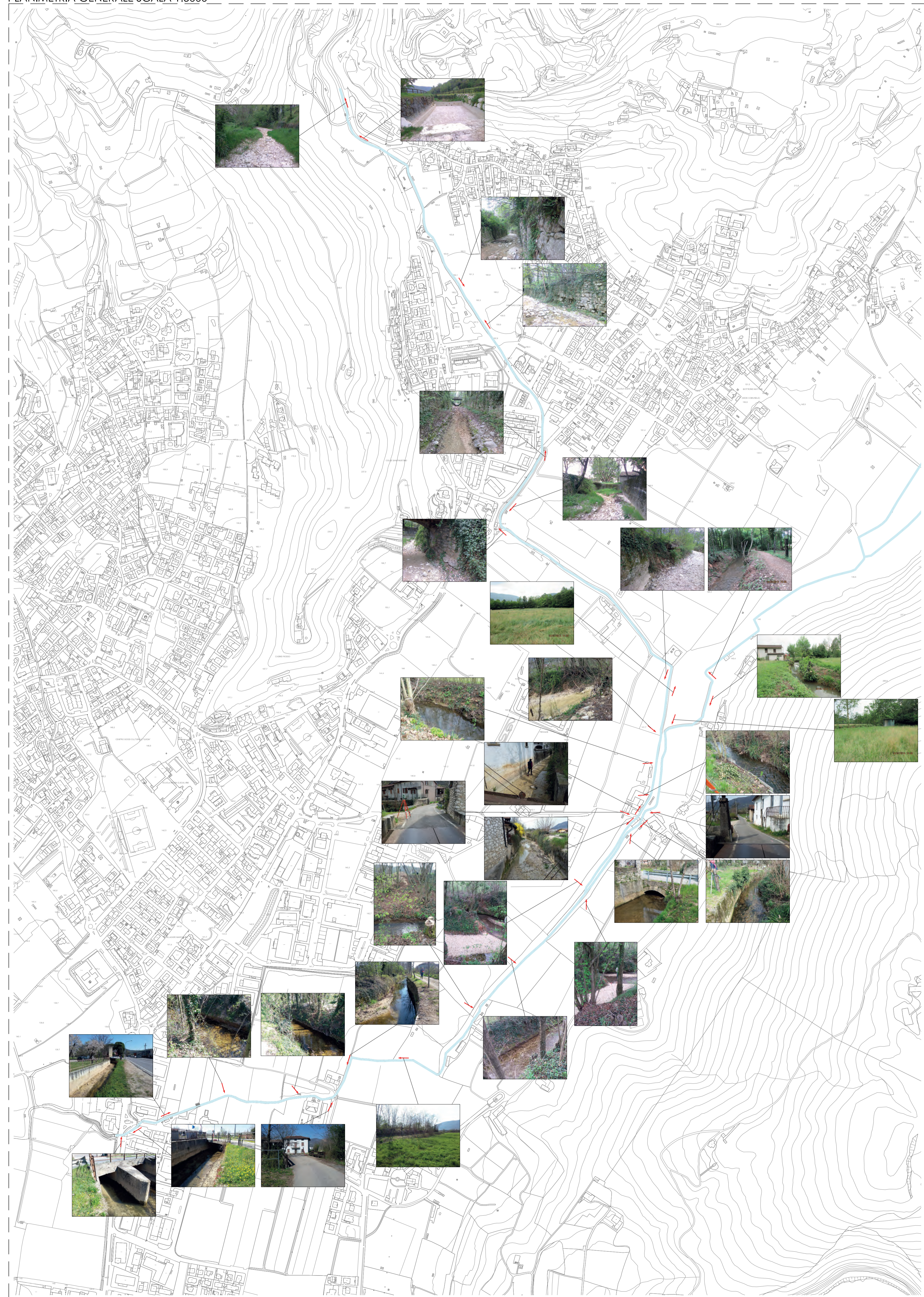
PLANIMETRIA GENERALE SCALA 1:5000